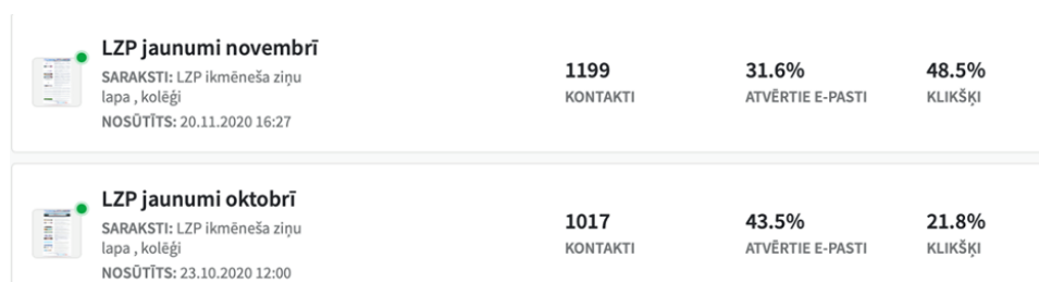
7.1. att. Pārskats par ziņu lapas saņēmējiem un atvērtajiem e-pastiem 2020. gada 23. novembrī.

Kopš 2020. gada jūnija LZP sagatavo un izsūta ikmēneša ziņu lapu, kurai kopš septembra ir vairāk nekā 1000 abonenti (2020. novembrī abonentu skaits sasniedza 1187). Ziņu lapas satura veidošanā tiek piesaistīti arī IZM Augstākās izglītības, zinātnes un inovāciju departamenta darbinieki un Valsts izglītības attīstības aģentūras Zinātnes, pētniecības un inovāciju politikas atbalsta departamenta darbinieki, iesūtot būtiskas zinātnes aktualitātes līdz katra mēneša 15. datumam. Vienlaikus ir nodibināti kontakti un aktuālās informācijas apmaiņa norisinās ar LIAA un CFLA. Oktobrī tika iepirkta e-pastu mārketinga sistēma "Mailigen", lai uzlabotu ziņu lapas vizuālo izskatu.