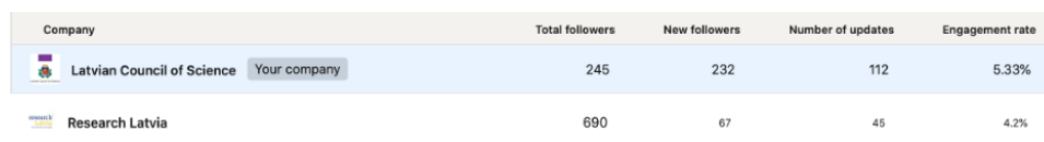
7.2. att. Pārskats pār LinkedIn auditoriju 2020. 23. novembrī salīdzinājumā ar Research Latvia.